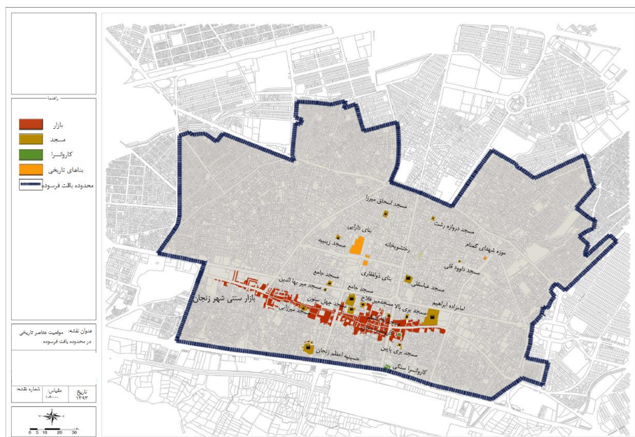
شکل ۲. موقعیت نقاط گردشگری شهر زنجان