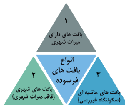
شکل ۲. انواع بافت‌های فرسوده

ج. بافت‌های حاشیه‌ای (سکونتگاه‌های غیررسمی) . مراد از بافت‌های حاشیه‌ای، بافت‌های فرسوده‌ای است که به علت نبود تناسب میان درآمد متقاضیان سکونت در شهرهای بزرگ و هزینه‌های سکونت در آن‌ها، بیشتر به طور غیر رسمی در حاشیه شهرها شکل گرفته‌اند. ساکنان این بافت‌ها، بیشتر مهاجران جویای کار هستند که در شهرهایی ساکن شده‌اند که توانمندی‌های زیاد در عرصه‌های اشتغال و خدمات دارند (مهندسین مشاور شاران، ۱۳۸۴، ص. ۹).