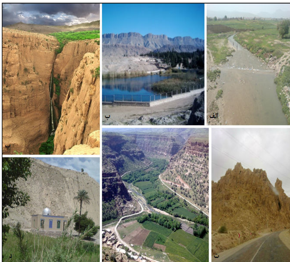
شکل ۲- لندفرم‌های مورد مطالعه: الف. رود الوند؛ ب. سراب گیلان غرب؛ پ. آبشار پیران؛

با دقت در تصاویر ماهواره‌ای، مشاهده نقشه‌های توپوگرافی و مشاهده‌های میدانی، ۶ لندفرم برجسته و دارای اهمیت برای گردشگری؛ یعنی، آبشار پیران، سراب گیلان غرب، چشمه امام حسن (ع)، دره گلین، تنگه حاجیان و رود الوند انتخاب شدند (شکل ۲). ویژگی‌های هر لندفرم در جداول (۶) تا (۱۱) آورده شده‌اند: