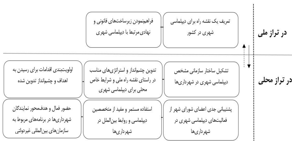
شکل ۳- پیشنهادها برای ایجاد تغییر در رویه‌های موجود و تقویت دیپلماسی شهری در کشور

تعریف یک نقشه راه برای دیپلماسی شهری در تراز ملی و فراهم کردن زیرساخت‌های قانونی و نهادی آن به همراه اقداماتی که در تراز محلی باید انجام شود، و آموختن از رویکردها و تجارب در دیگر شهرهای جهان در سایه اقدامات پیشنهاد نخست. (شکل ۳).