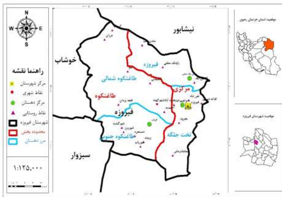
شکل ۲. تقسیمات سیاسی شهرستان فیروزه استان خراسان رضوی به همراه روستاهای بررسی شده

قلمرو جغرافیایی پژوهش شهرستان فیروزه است که یکی از شهرستان‌های استان خراسان رضوی محسوب می‌شود. این شهرستان از شمال و شرق به بخش مرکزی شهرستان نیشابور، از جنوب به بخش میان جلگه نیشابور، از شمال غربی به بخش سرولایت نیشابور و از غرب به بخش‌های مرکزی و مشکان شهرستان خوشاب و بخش مرکزی شهرستان سبزوار محدود می‌شود. این شهرستان در سال ۱۳۹۵ دارای دو بخش به نام‌های مرکزی و طاغنکوه، چهار دهستان به نام‌های تحت جلگه، فیروزه، طاغنکوه شمالی و طاغنکوه جنوبی و دو شهر به نام‌های فیروزه و همت‌آباد و ۱۰۵ آبادی دارای سکنه بوده است. شهرستان فیروزه در سال ۱۳۹۵ دارای ۳۷۵۳۹ نفر جمعیت (۱۱۷۸۳ خانوار) بوده است. از این تعداد، ۷۱۵۸ نفر ساکن نقاط شهری (معادل ۱۹,۰۷ درصد) و ۳۰۳۸۱ نفر ساکن نقاط روستایی (معادل ۸۰,۹۳ درصد) بوده است (مرکز آمار ایران، ۱۳۹۵).