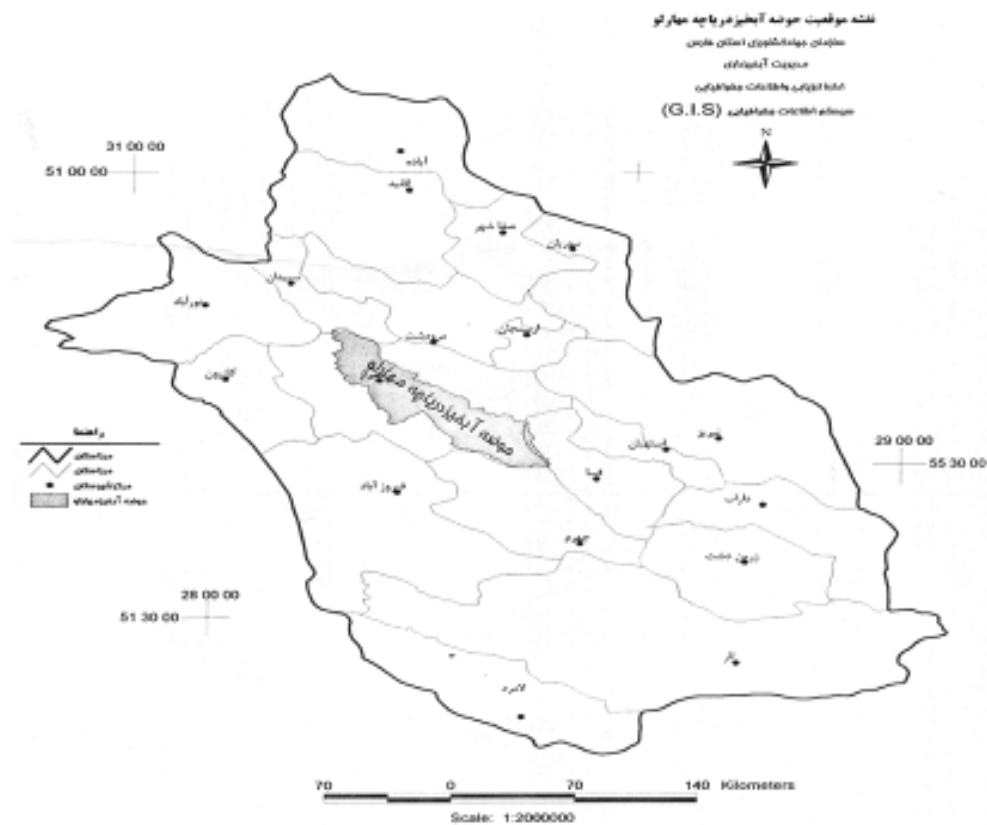
نقشه ۱: موقعیت حوضه‌ی آبریز دریاچه‌ی مهارلو در استان فارس

منطقه مورد مطالعه در رشته کوه‌های زاگرس قرار گرفته و طی دوران‌های زمین‌شناسی، دستخوش تحولات فراوانی شده است. قدیمی‌ترین سنگ‌های آن را آهک‌های سازند بنگستان (سنومانین) و جدیدترین آن را آبرفت‌های (شن، ماسه، سیلت، رس) کواترنر تشکیل می‌دهد. آهک‌های آسماری-سجهرم