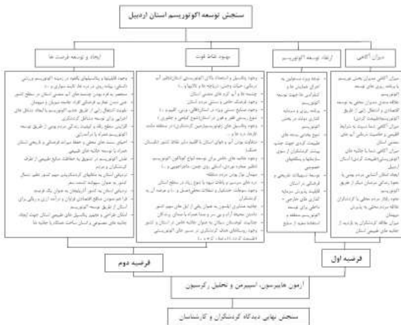
شکل ۱- مدل مفهومی تحقیق