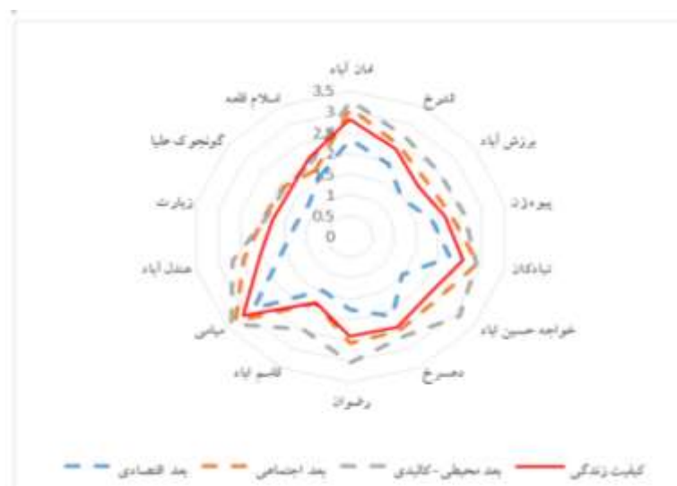
شکل ۳- رادار نقش گردشگری بر سازه کیفیت زندگی و ابعاد آن