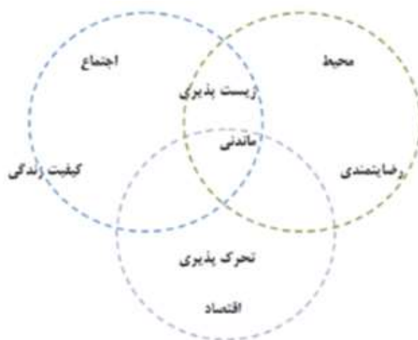
شکل ۲- مدل عوامل سهیم در کیفیت زندگی از دیدگاه اکولوژی انسانی

و پایداری (ماندنی) در ارتباط متقابل با همدیگر بیان شده است (وان کمپ، لیدرمرجر، میسون و دی هولاندر ۱ ، ۲۰۰۳، ص. ۱۱) که زیست‌پذیری نتیجه تأمین مطلوب محیطی و اجتماعی است و بیشتر از نظر زمانی، نگاه به حال حاضر دارد، اما پایداری بیشتر متأثر از جنبه‌های محیطی است که از نظر زمانی نگاه به آینده دارد. در واقع می‌توان حوزه‌های اجتماعی-محیطی-اقتصادی را به عنوان سه رکن اصلی کیفیت زندگی در نظر گرفت. لازم به ذکر است محققان و صاحب‌نظران متعددی کیفیت زندگی را در ابعاد اجتماعی، محیطی و اقتصادی مورد بررسی قرار داده‌اند. به عقیده مایرس ۲ کیفیت زندگی ریشه در کفایت اقتصادی، محیطی و الزامات اجتماعی دارد (مایرس، ۱۹۸۷، ص. ۱۵۱) و عبارت است از شرایط اجتماعی، فرهنگی، اقتصادی و کالبدی-فضایی (خواجه شاهکوهی، مینایی، ۱۳۹۳، ص. ۵) به رغم تکثرگرایی مفهومی و عملیاتی، کیفیت زندگی عموماً یک مفهوم چندبعدی است (مک‌گیلوری ۳ ، ۲۰۰۶، ص. ۴۱) که با توسعه اقتصادی-اجتماعی و بهبود و بهسازی سطوح زندگی اهمیت می‌یابد و ویژگی‌های کلی اجتماعی، اقتصادی محیط در یک ناحیه را نشان می‌دهد (محمدپورجباری، ۱۳۹۳، ص. ۳۸) (شکل ۲).