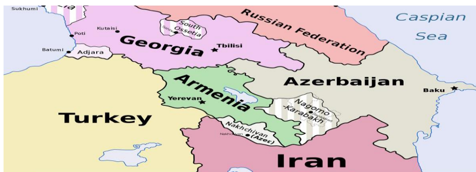
شکل ۱. موقعیت ژئوپلیتیکی قفقاز جنوبی