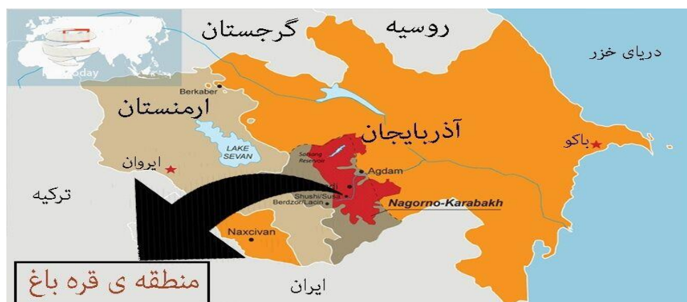
نقشه ۲. موقعیت جغرافیایی قره‌باغ

در جریان جنگ ۲۰۲۰ قره‌باغ، مقامات سیاسی ترکیه به شدت از جمهوری آذربایجان حمایت نظامی و سیاسی کردند. این اقدامات در آینده منجر به این خواهد شد که سطح تعاملات و روابط میان ترکیه و آذربایجان عمیق‌تر شود و شاهد حضور چشمگیرتر ترکیه در منطقه ژئوپلیتیکی قفقاز باشیم. بر مبنای قرارداد صلح نوامبر ۲۰۲۰، ترکیه نیروهای خود را در آذربایجان حفظ خواهد کرد و از طریق کریدور پیشنهادی نخجوان-جمهوری آذربایجان، به طور مستقیم به دریای خزر دسترسی پیدا خواهد کرد. این طرح همچنین می‌تواند به صورت مستقیم بر آسیای میانه تأثیر بگذارد که یکی از اهداف مورد علاقه رجب طیب اردوغان، رئیس جمهور ترکیه، است. این امر به طور درخور توجهی به تحقق رویاهای ترکیه، برای متحد کردن جهان ترک تحت رهبری آنکارا کمک خواهد کرد. هدف آنکارا بیش از هر چیز حضور در تحولات میدانی آتی قفقاز جنوبی و آسیای میانه است و جمهوری آذربایجان در حکم دروازه ورود آنکارا به این مناطق محسوب می‌شود (محمود اوغلی و همکاران، ۱۴۰۱، ص. ۹۵). ترکیه به لحاظ راهبردی سعی دارد از طریق روابط اقتصادی، سیاسی، فرهنگی و حتی نظامی با دولت‌های ترک‌زبان به ویژه جمهوری آذربایجان جایگاه خود را در قفقاز جنوبی ارتقا بخشد. در نقشه «جهان ترک» که اخیراً نمایندگان احزاب ناسیونالیست به اردوغان تحویل داده‌اند، جمهوری آذربایجان، تمام آسیای مرکزی، برخی از مناطق ایران، مغولستان و بخش‌های بزرگی از روسیه با عنوان «دنیای ترک» برجسته شده‌اند (هایراپتیان، ۲۰۲۲، ص. ۳۹).