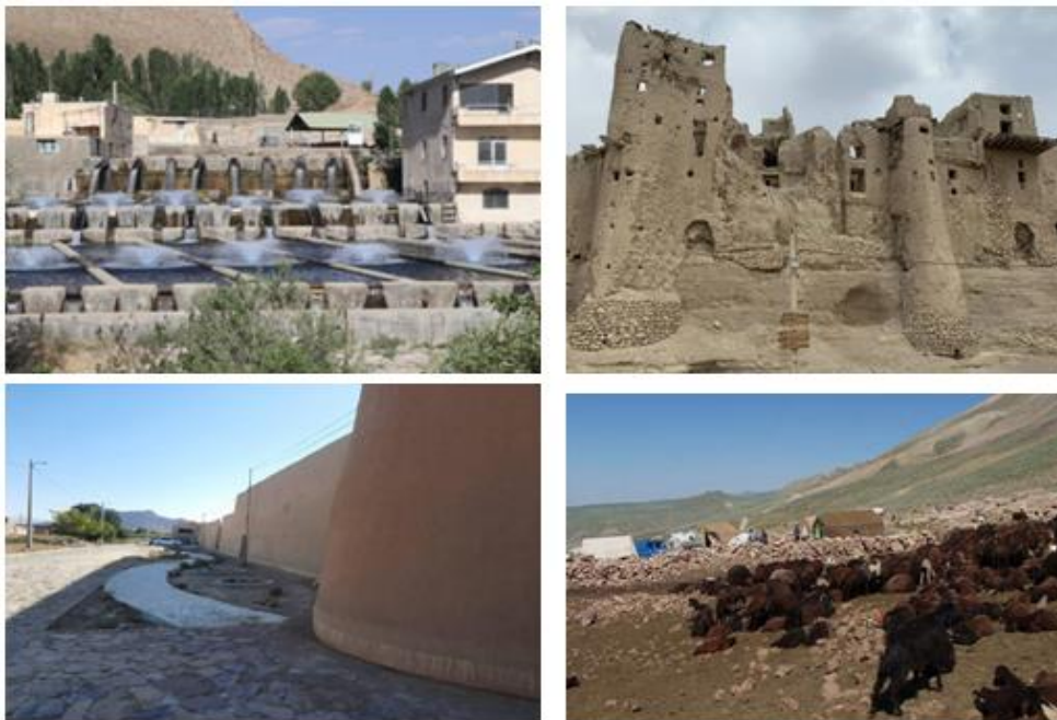
تصاویر ۱- برخی جاذبه های گردشگری روستایی برگزیده به ترتیب از راست به چپ: قلعه ایزدخواست؛ روستای خسروشیرین؛ عشایر منطقه؛ روستای چنار.