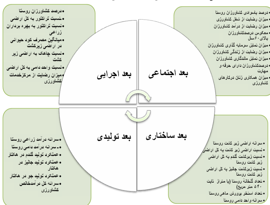
شکل ۱: ابعاد و شاخص‌های ارزشیابی توان کشاورزی

با لحاظ رهیافت کلی نگر* مبتنی بر ضرورت دید جامع در درک و تحلیل ابعاد بوم‌شناختی - محیطی، اجتماعی و اقتصادی توسعه (Shepherd, 1998: 6)، و ملحوظ داشتن دیدگاه‌های نظری، معرفه‌های سطح توسعه‌ی روستایی در سه ابعاد تعیین، اندازه‌گیری مورد تحلیل قرار گرفته‌اند (شکل و جدول ۲).