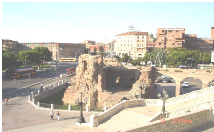
ماخذ: نویسنده، تاریخ عکس برداری، شهریور ۱۳۸۴