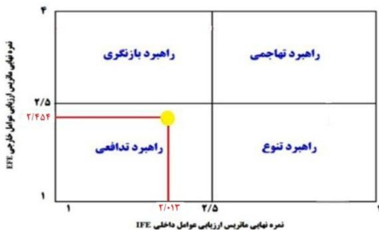
شکل ۱. ماتریس داخلی و خارجی کشاورزی فراسرزمینی (IEM)

محورهای X و Y رسم می‌شوند؛ بدین صورت که جمع امتیازهای نهایی ارزیابی عوامل داخلی روی محور X ها و جمع امتیازهای نهایی ارزیابی عوامل خارجی روی محور Y ها نشان داده می‌شود. نقطه تلاقی جمع امتیازهای عوامل داخلی و خارجی کشاورزی فراسرزمینی روی محور X ها و Y ها، تعیین‌کننده موقعیت کشاورزی فراسرزمینی در ماتریس راهبردها و اولویت‌های اجرایی است. موقعیت کشاورزی فراسرزمینی ایران در ماتریس راهبردها، تعیین‌کننده راهبردهای قابل قبول برای بهبود وضعیت کشاورزی فراسرزمینی ایران است. این راهبردها، راهبردهای مبتنی بر محیط تدافعی هستند؛ بنابراین هنگام برنامه‌ریزی، مبنای قرار دادن راهبردهای تدافعی در اولویت قرار دارند (شکل ۱).